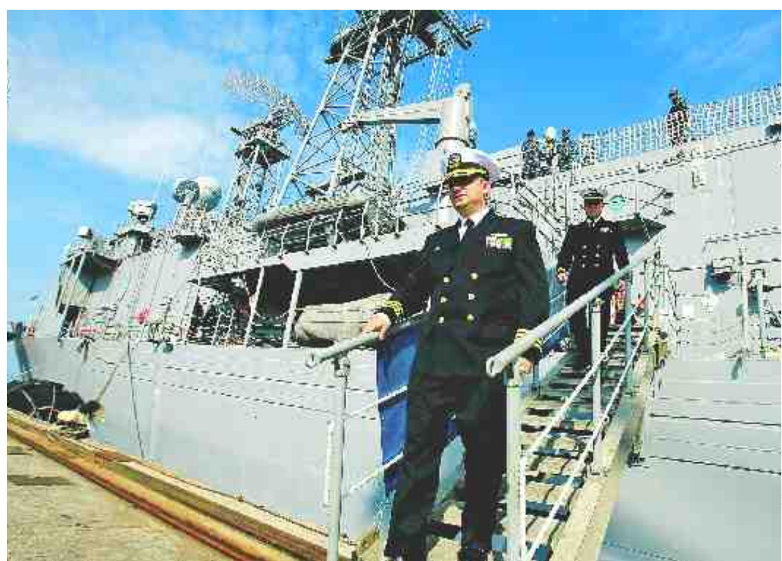
PRVIČ V JADRANSKEM MORJU – Ameriška fregata je pred slovenskim pristaniščem že obiskala Romunijo, Turčijo, Grčijo in Grčijo.