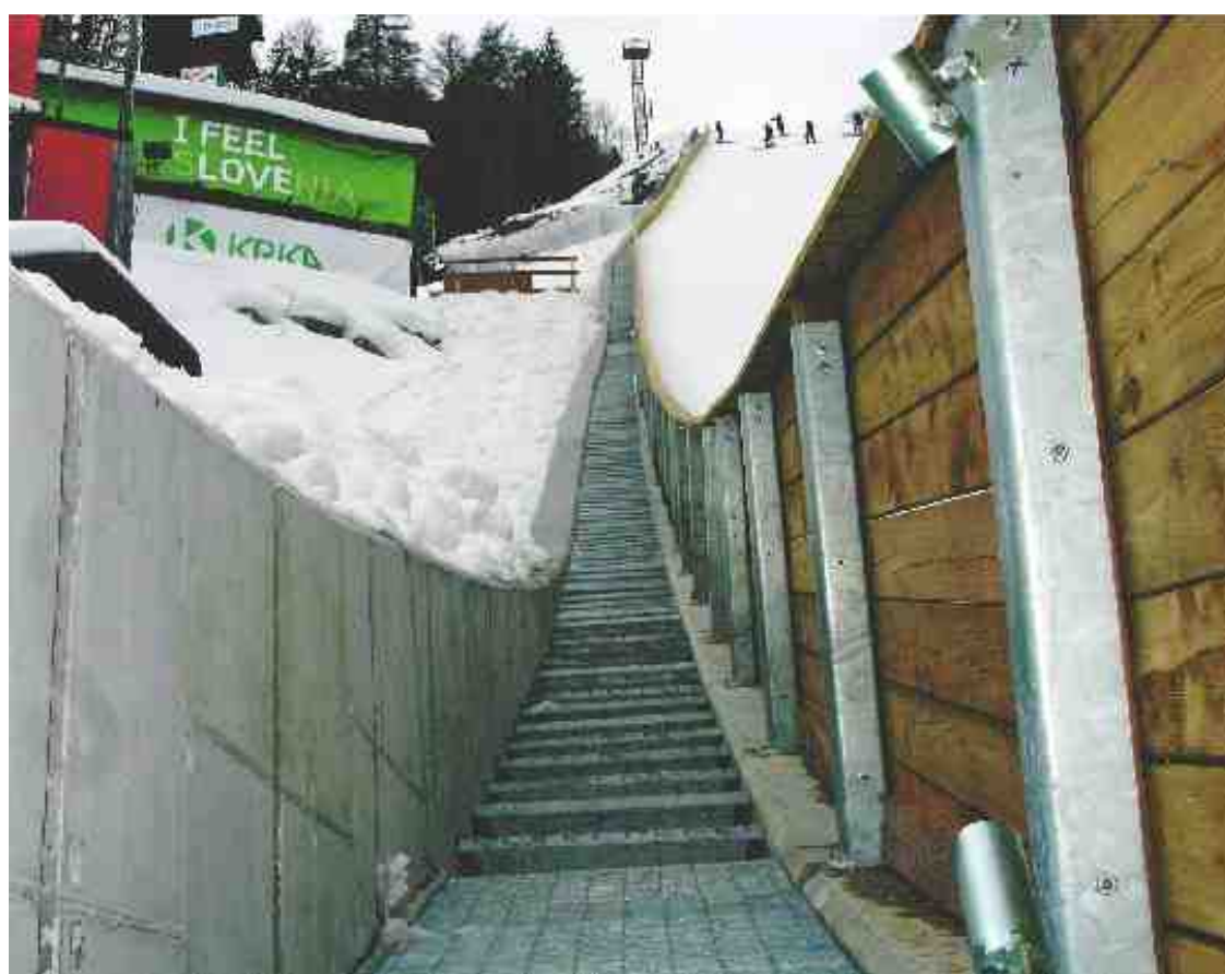
ČRNA GRADNJA – Ministrstvo za šolstvo in šport je vlogo za dovoljenje za gradnjo opornega zidu na levi strani doskočišča vložilo šele 22. februarja, čeprav je bil takrat že sezidan. Gradbeno dovoljenje pričakujejo do konca tega meseca, do takrat pa bo zid črna gradnja.

LJUBLJANA – Poklicno maturo iz vseh štirih predmetov je v zimskem roku uspešno opravilo 425 od 587 kandidatov oziroma 72,4 odstotka vseh udeležencev (lani 77 odstotkov). Preizkus je na 150 srednjih solah in ustanovah za izobraževanje odraslih opravljalo 1741 kandidatov (lani 1747), od tega 187 dijakov in 1554 odraslih. Nekateri so maturo opravljali delno, drugi pa iz vseh štirih predmetov: dva obvezna – materni jezik in strokovni-teoretični predmet, in dva izbirna – tuji jezik ali matematika ter praktični izdelek. Zimski izpitni rok poklicne mature je potekal med 9. in 26. februarjem. Tisti, ki niso bili uspešni, bodo lahko znanje znova preverili v spomladanskem roku med 26. majem in 24. junijem. N. D.